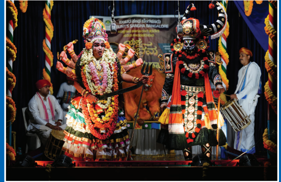
ಯಕ್ಷಗಾನ ಮತ್ತು ರಂಗತರಬೇತಿ ಸಮಿತಿ - ಶ್ರೀ ದೇವಿ ಮಹಾತ್ಮೆ ಯಕ್ಷಗಾನ

ಸಮಾಜಮುಖಿ ಸೇವೆ-ನಿಸ್ವಾರ್ಥ ಬದುಕಿನ ನಿಜವಾದ ಅರ್ಥ