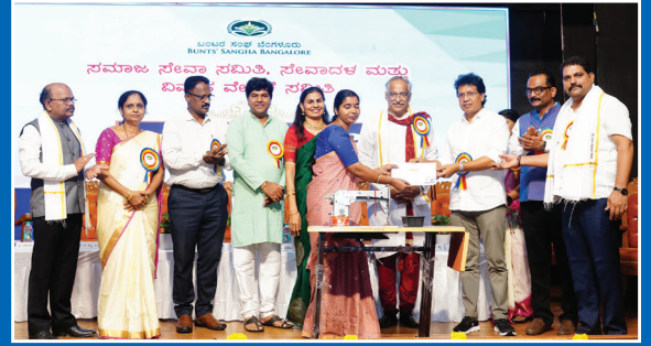
ಸಮಾಜ ಸೇವಾ ಸಮಿತಿ, ಸೇವಾದಳ ಮತ್ತು ವಿವಾಹ ವೇದಿಕೆ ಸಮಿತಿ - ಸೇವಾ ಸಮಾಗಮ - 2026