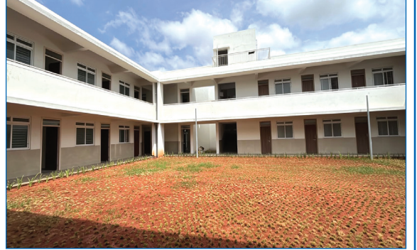
ವಿದ್ಯಾರ್ಥಿನಿ ನಿಲಯದ ಒಳಾಂಗಣ