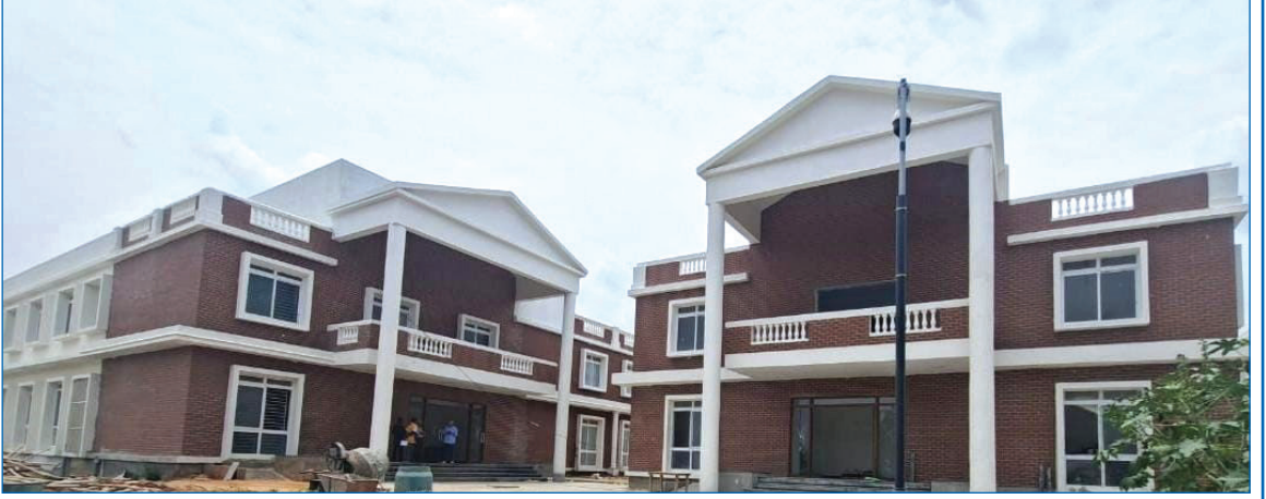
ವಿದ್ಯಾರ್ಥಿನಿ ನಿಲಯ ಮತ್ತು ಭೋಜನ ಶಾಲೆಯ ಹೊರನೋಟ