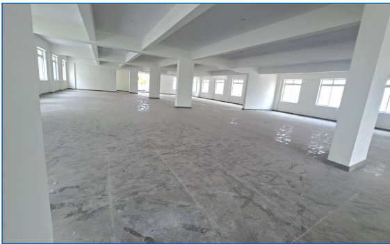
ಭೋಜನ ಶಾಲೆ ಒಳಾಂಗಣ