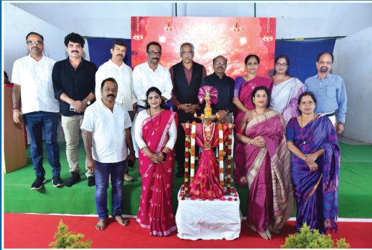
ಸಂಕಲ್ಪ ವಿದ್ಯಾರ್ಥಿಗಳ Orientation ಕಾರ್ಯಕ್ರಮ