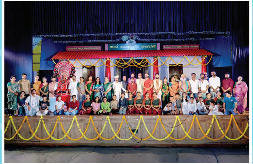
ಬಸು (ಯುಗಾದಿ) ಆಚರಣೆ