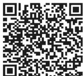
SCAN FOR PAYMENT