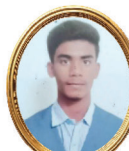
SAVINAYA N 94.1% - 565/600