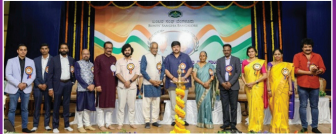
ರಾಧಾಬಾಯಿ ತಿಮ್ಮಪ್ಪ ಭಂಡಾರಿ ಸ್ಮಾರಕ ವಾರ್ಷಿಕ ಕ್ರೀಡಾ ಮತ್ತು ಸಾಂಸ್ಕೃತಿಕ ದಿನಾಚರಣೆ