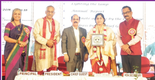
ಬಂಟರ ಸಂಘ ಆರ್.ಎನ್.ಎಸ್. ವಿದ್ಯಾನಿಕೇತನ ಪ್ರಾಥಮಿಕ ವಿಭಾಗ ವಾರ್ಷಿಕೋತ್ಸವ