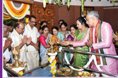
ಶ್ರೀ ವರಸಿದ್ದಿ ವಿನಾಯಕ ಪ್ರಾರ್ಥನಾ ಮಂದಿರ-ರಜತ ಮಹೋತ್ಸವ ಸಂಪನ್ನ