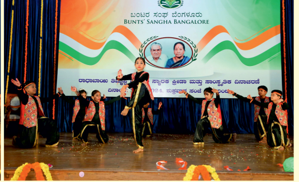
ರಾಧಾಬಾಯಿ ತಿಮ್ಮಪ್ಪ ಭಂಡಾರಿ ಸ್ಮಾರಕ ಕ್ರೀಡಾ ಮತ್ತು ಸಾಂಸ್ಕೃತಿಕ ದಿನಾಚರಣೆ