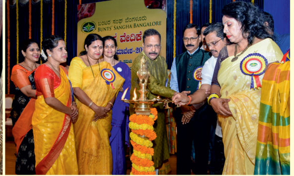
ವಿವಾಹ ವೇದಿಕೆ ಸಮಿತಿ ವತಿಯಿಂದ ಜರುಗಿದ ವಧೂವರರ ಸಮಾವೇಶ