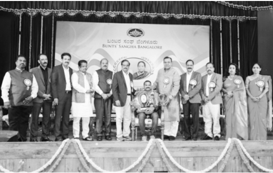
ಧನ್ಯವಾದ ಸಮರ್ಪಣೆಯೊಂದಿಗೆ ಸಭಾಕಾರ್ಯಕ್ರಮವು ಮುಕ್ತಾಯವಾಯಿತು.