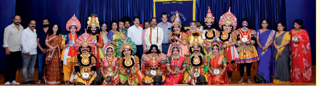
ರಂಗತರಬೇತಿ ಮತ್ತು ಯಕ್ಷಗಾನ ಸಮಿತಿ-ಯಕ್ಷಗಾನ ಕಾರ್ಯಕ್ರಮ