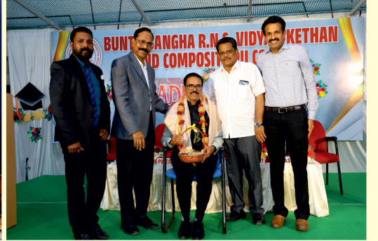
Bunts Sangha R.N.S Vidyaniketan and Composite PU College - Graduation day