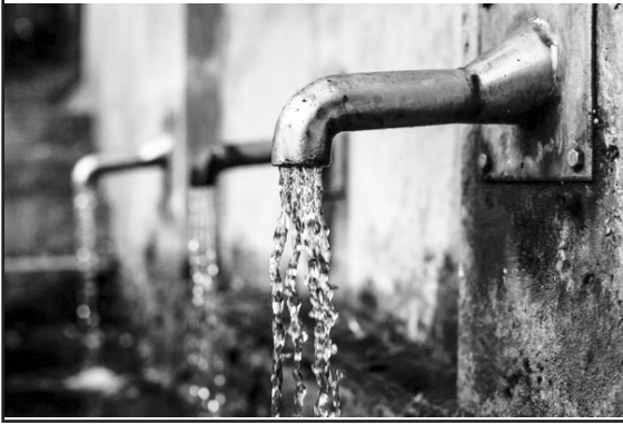
Wastage of water

borewells, further contributing to the decline of groundwater levels. If this water is not replenished naturally, it can lead to land sinking and damage to infrastructure and residential areas.