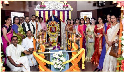
ಪ್ರಾರ್ಥನಾ ಮಂದಿರ ಸಮಿತಿ - ಶ್ರೀ ವರಸಿದ್ಧಿ ವಿನಾಯಕ ಪ್ರಾರ್ಥನಾ ಮಂದಿರದ ವಾರ್ಷಿಕೋತ್ಸವ ಸಮಾರಂಭ