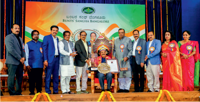
ರಾಧಾಬಾಯಿ ತಿಮ್ಮಪ್ಪ ಭಂಡಾರಿ ಸ್ಮಾರಕ ಕ್ರೀಡಾ ಮತ್ತು ಸಾಂಸ್ಕೃತಿಕ ದಿನಾಚರಣೆ