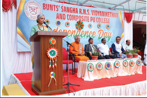
ವಿದ್ಯಾಮಂದಿರದೊಳಗೆ ಹೊಸ ಹುರುಪಿನ ಸಂಭ್ರಮದ ಸ್ವಾತಂತ್ರ್ಯೋತ್ಸವ