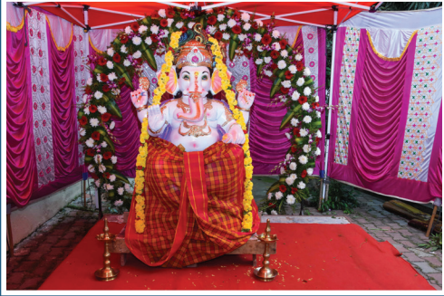
ವೈಭವದ ಗಣೇಶ ಚತುರ್ಥಿ ಸೊಬಗು ಕಂಡ ಬೆಂಗಳೂರು ಬಂಟರ ಸಂಘ