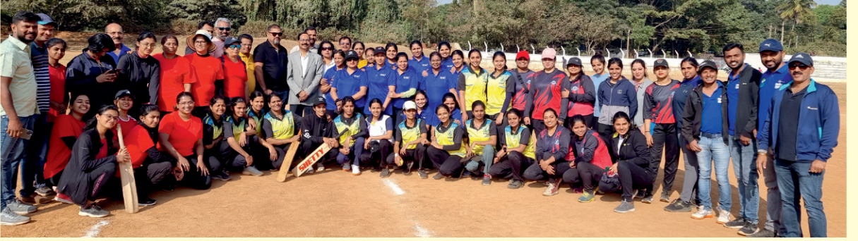
Radhabai Thimmappa Bhandary Annual Sports Competitions 2023-24