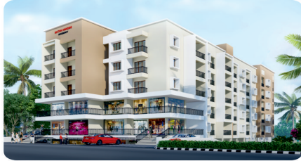
MATHA NANDINI RESIDENCY PAKSHIKERE