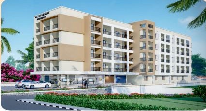
MATHA SHABARI RESIDENCY NH-66, MUKKA

BUDGET 18 LAKHS FLATS ONWARDS COST INCLUDING GST JUST ₹50K PAY TO BOOK YOUR DREAM HOME