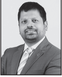
Dr. Santosh Shetty

Peace is a universal aspiration, and education is a powerful tool for achieving it. The concept of "peace education" has gained prominence as societies seek to promote understanding, tolerance, and harmony in an increasingly interconnected