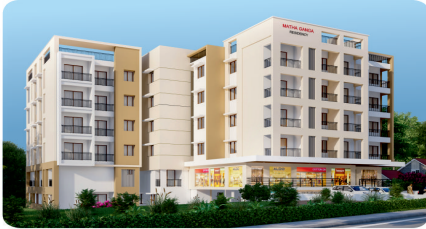
MATHA GANGA RESIDENCY PADMANOOR - KINNIGOLI