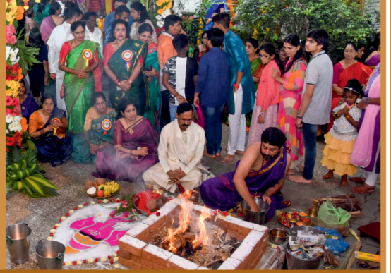
ಪ್ರಾರ್ಥನಾ ಮಂದಿರ ಸಮಿತಿ - ಗಣೇಶ ಚತುರ್ಥಿ ಆಚರಣೆ