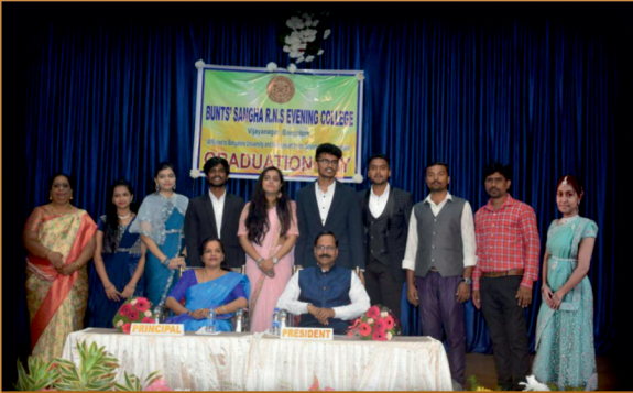
Bunts Sangha R.N.S. Evening College - Graduation Day