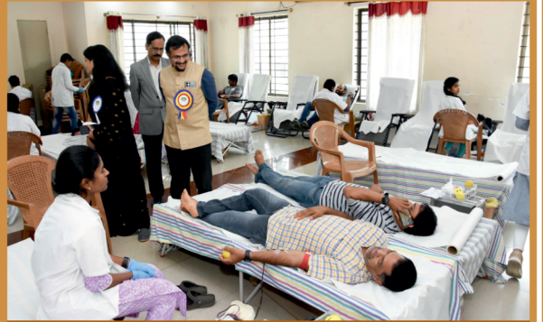
ಸಮಾಜ ಸೇವಾ ಸಮಿತಿ ಮತ್ತು ಬಂಟ್ ಸೇವಾದಳ - ಬೃಹತ್ ರಕ್ತದಾನ ಶಿಬಿರ