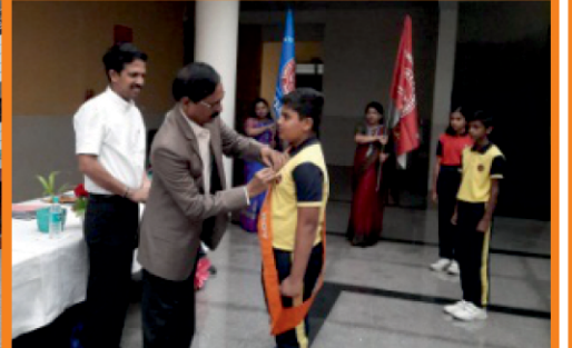
Bunts Sangha R.N.S. Vidyaniketan-II Investiture Ceremony

ಸರ್ವ ಸದಸ್ಯರಿಗೆ ದೇಶದ 76ನೇ ಸ್ವಾತಂತ್ರ್ಯೋತ್ಸವದ ಶುಭಾಶಯಗಳು