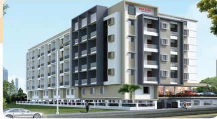
MATHA SUSHIGANGA RESIDENCY NH-66 MULKY