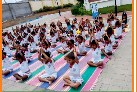
Bunts Sangha R.N.S. Vidyaniketan-II Yoga Day