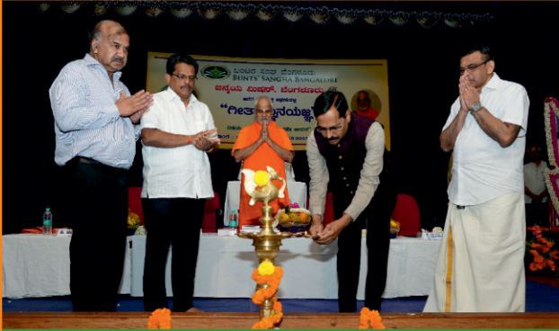
ಬಂಟರ ಸಂಘ ಬೆಂಗಳೂರು ಮತ್ತು ಚಿನ್ನಯ ಮಿಷನ್ ಸಂಯುಕ್ತ ಆಶ್ರಯದಲ್ಲಿ ನಡೆದ ಗೀತಾಜ್ಞಾನಯಜ್ಞ