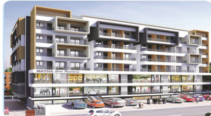
MATHA GURU RESIDENCY NH-66, PADUBIDRI

Project Approved in all Nationalized Bank