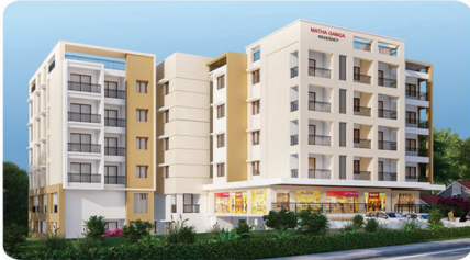
MATHA GANGA RESIDENCY PADMANOOR - KINNIGOLI