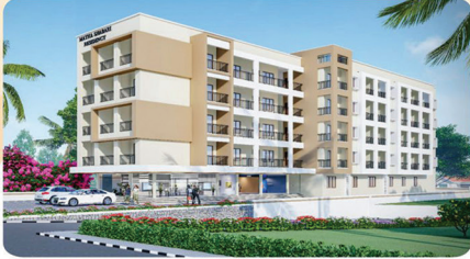
MATHA SHABARI RESIDENCY NH-66, MUKKA