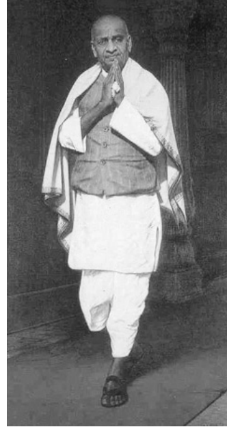
Iron Man of India Sardar Patel