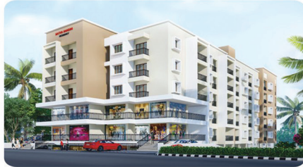
MATHA NANDINI RESIDENCY PAKSHIKERE