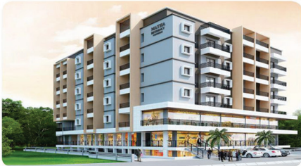
MATHA RESIDENCY NH-66, PADUBIDRI