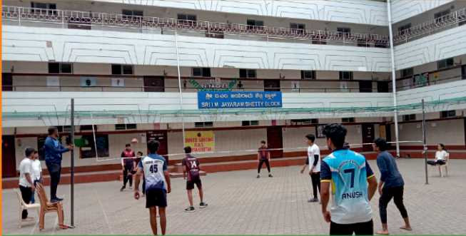
Bunts Sangha R.N.S. Evening College Sports Day