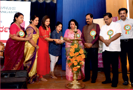
ಮಹಿಳಾ ವಿಭಾಗ - ಅಂತರರಾಷ್ಟ್ರೀಯ ಮಹಿಳಾ ದಿನಾಚರಣೆ - 'ಸ್ತ್ರೀ ಪರ್ವ'