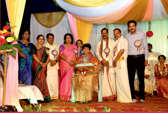
ವಿವಾಹ ವೇದಿಕೆ - ಕಂಕಣ ಭಾಗ್ಯ ಯೋಜನೆಯಡಿಯಲ್ಲಿ ಉಚಿತ ವಿವಾಹ