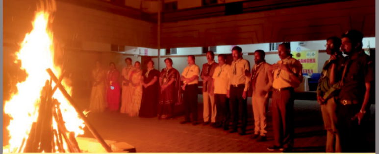
Campfire by Scouts students