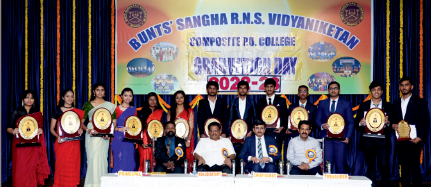
Bunts Sangha R.N.S. Vidyaniketan Composite P.U. College - Graduation Day