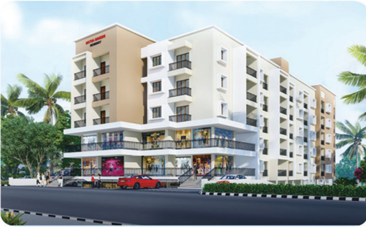
MATHA NANDINI RESIDENCY PAKSHIKERE

NEAR TO BEACH & RAILWAY STATION INTERNATIONAL AIRPORT ROAD, SURATHKAL