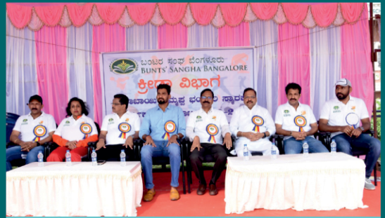
ರಾಧಾಬಾಯಿ ತಿಮ್ಮಪ್ಪ ಭಂಡಾರಿ ಸ್ಮಾರಕ ವಾರ್ಷಿಕ ಕ್ರೀಡಾಕೂಟದ ಉದ್ಘಾಟನಾ ಸಮಾರಂಭ