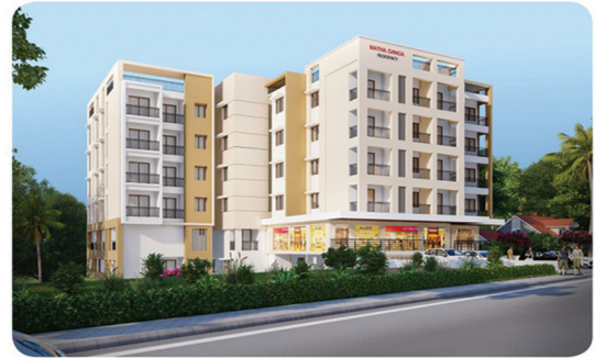
MATHA GANGA RESIDENCY PADMANOOR, KINNIGOLI