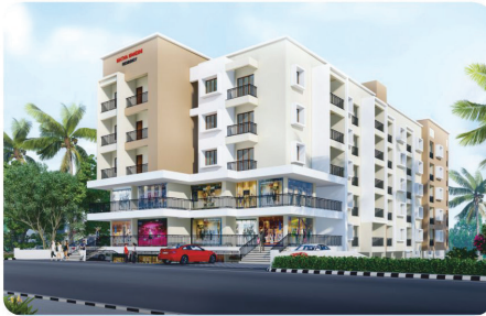
MATHA NANDINI RESIDENCY PAKSHIKERE

NEAR TO BEACH & RAILWAY STATION INTERNATIONAL AIRPORT ROAD, SURATHKAL