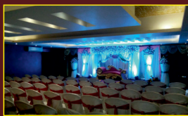
Spacious Banquet Hall