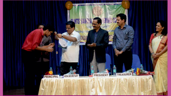
Bunts' Sangha RNS Evening College Farewell Programme