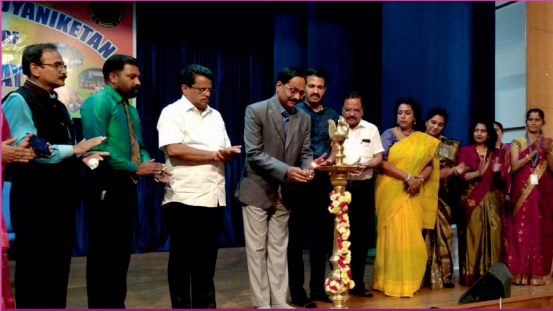
Teachers' Day Celebrations