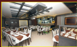
Add on Fine Dining