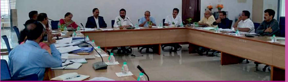
BSRNSV Governing Council Meeting