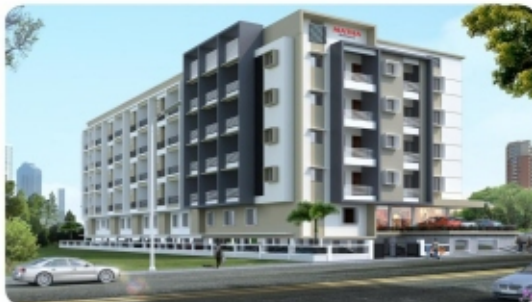
MATHA Sushiganga Residency NH-66, Mulky

NEAR TO BEACH & RAILWAY STATION International Airport Road, Surathkal