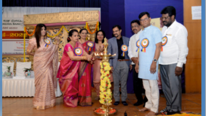
ವಿವಾಹ ವೇದಿಕೆ ಸಮಿತಿ ವತಿಯಿಂದ ನಡೆದ ಮಧೂ-ವರರ ಅನ್ವೇಷಣಾ ಕಾರ್ಯಕ್ರಮ.

324, Chord Road, Vijayanagara Bengaluru - 560 040. Ph: 080 2339 9323/ 2339 9635 E: info@buntsanghablr.com