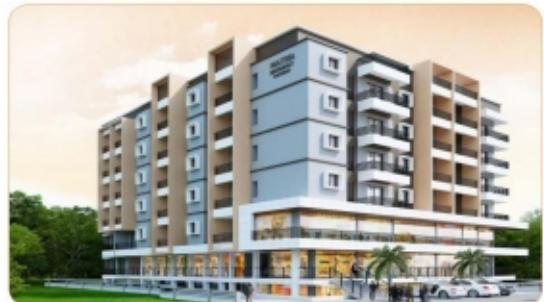
MATHA Residency NH-66, Padubidri