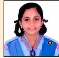
ಕುಮಾರಿ ಆಪ್ತ ಶೆಟ್ಟಿ ಶೀತಲ್ ಕೃಷ್ಣಪ್ಪ ಸ್ಮಾರಕ ಪ್ರಶಸ್ತಿ - 'ವಿವಿಧ ಕ್ಷೇತ್ರದಲ್ಲಿನ ಸರ್ವತೋಮುಖ ಪ್ರತಿಭೆ'ಗಾಗಿ (ವಿದ್ಯಾರ್ಥಿನಿ)