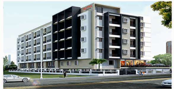
MATHA Sushiganga Residency, Mulky NH - 66, Mulky