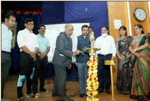
ವಿದ್ಯಾರ್ಥಿ ವೇತನ ಮತ್ತು ಪ್ರಶಸ್ತಿ ಸಮಿತಿ ವತಿಯಿಂದ ಪ್ರತಿಭಾ ಪುರಸ್ಕಾರ ಹಾಗೂ ದತ್ತಿ ನಿಧಿ ಪ್ರಶಸ್ತಿ ವಿತರಣೆ

ಡಿ ಕೆ.ಎಸ್. ಹರ್ಷವರ್ಧನ್ ಶೆಟ್ಟಿ ಸ್ಮಾರಕ ಪ್ರಶಸ್ತಿ - ವೃತ್ತಿಪರ ಶಿಕ್ಷಣ ಪಡೆಯುತ್ತಿರುವ ತಂದೆಯನ್ನು ಕಳೆದುಕೊಂಡಿರುವ ವಿದ್ಯಾರ್ಥಿನಿ.