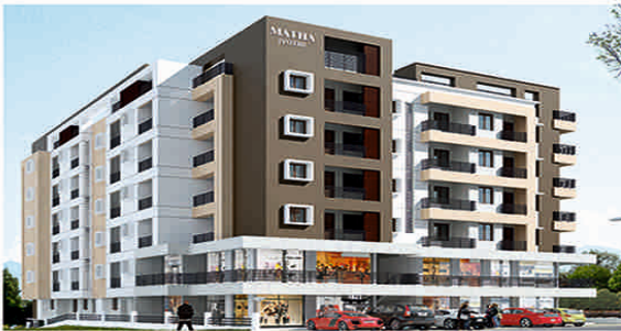
MATHA Jyothi Residency NH - 66, Mukka

NEAR TO BEACH & RAILWAY STATION International Airport Road, Surathkal