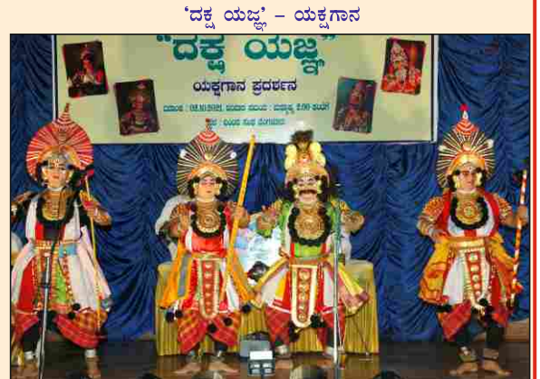
'ದಕ್ಷ ಯಜ್ಞ' - ಯಕ್ಷಗಾನ

ಯಕ್ಷಗಾನ ಪ್ರದರ್ಶನ ದಿನಾಂಕ : 08.10.2021, ಸಮಯ : ಮಧ್ಯಾಹ್ನ 2:00 ರಿಂದ ಸ್ಥಳ : ಯಜ್ಞ ಕೂಟ ಮಂಟಪ