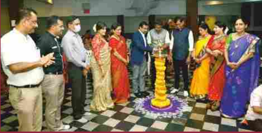
ಮಹಿಳಾ ವಿಭಾಗದ ವತಿಯಿಂದ ದಸರಾ ಆಚರಣೆ