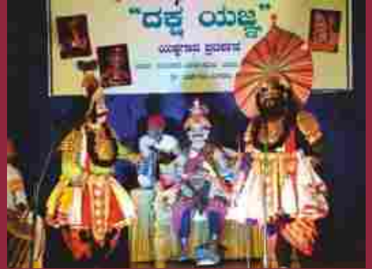
ರಂಗತರಬೇತಿ ಮತ್ತು ಯಕ್ಷಗಾನ ಸಮಿತಿ ವತಿಯಿಂದ ದಕ್ಷ ಯಜ್ಞ ಯಕ್ಷಗಾನ