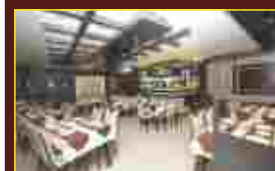
Add on Fine Dining