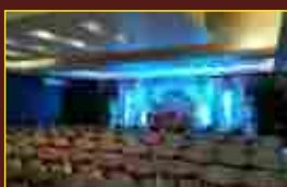
Spacious Banquet Hall