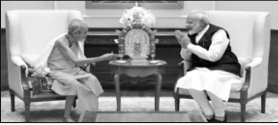
On Guru Purnima this July, the great seer had met Prime Minister, His highness Sri Narendra Modi

Karnataka State Government by a statute.