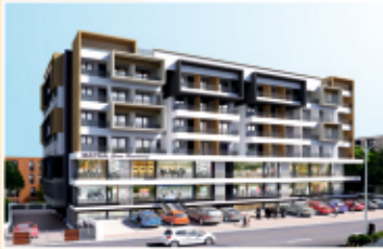
MATHA Guru Residency NH-66, Padubidri