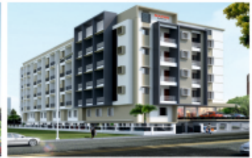
MATHA Residency NH-66, Mulky