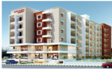
MATHA Residency Pakshikere