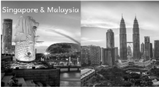
Singapore & Malaysia

Enchanting Europe 6th-20th Apr 2020, 14N/15D @2,30,000 (Approx.)