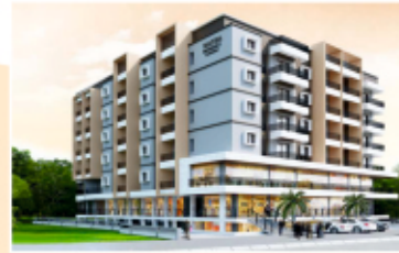
MATHA Residency NH-66, Padubidri

Project Approved in all Nationalized Bank