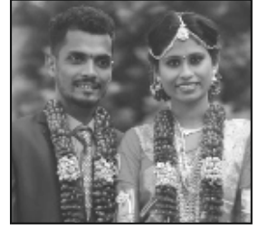
ಸನತ್ ಮತ್ತು ಶೀತಲ್