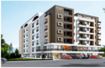
MATHA Jyothi Residency NH-66, Mukka