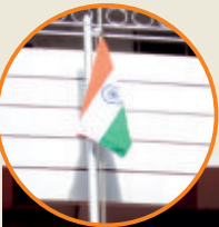
ಬಂಟರ ಸಂಘ ಆರ್.ಎನ್.ಎಸ್. ವಿದ್ಯಾನಿಕೇತನ ಸ್ವಾತಂತ್ರ್ಯ ದಿನಾಚರಣೆ