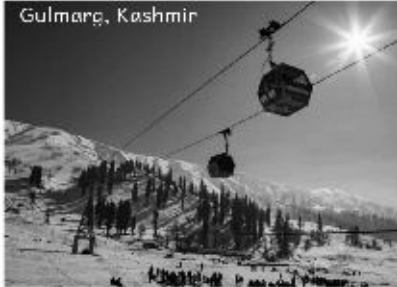
Vaishnodevi & Kashmir 6th 13th Apr 2020, 7N/8D @49,800 INR