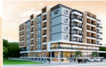
MATHA Residency NH-66, Padubidri

Project Approved in all Nationalized Bank