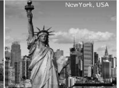
Majestic America 6th-19th June 2020, 13N/14D (Cost to be Announced)

ALL INCLUSIVE GROUP TOURS *HURRY UP !! ONLY LIMITED SEATS AVAILABLE.