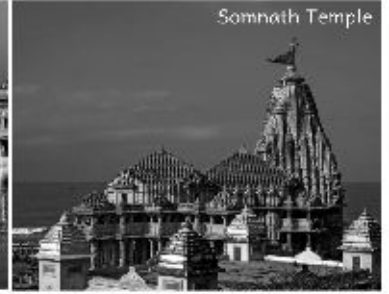
Panchdwarka with four Jyotirlinga 6th-16th Dec 2019, 10N/11D @42,500 INR