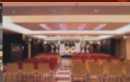
Spacious Banquet Hall