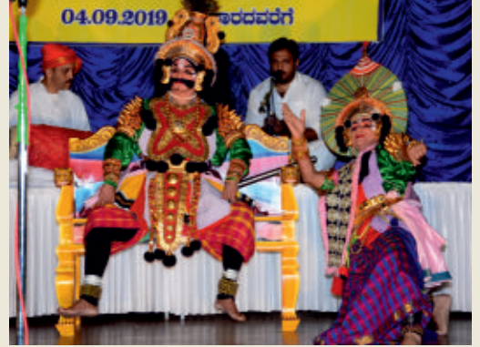
ಶ್ರೀ ವರಸಿದ್ದಿ ವಿನಾಯಕ ಪ್ರಾರ್ಥನಾ ಮಂದಿರ ಗಣೇಶ ಚತುರ್ಥಿ ಸಂಭ್ರಮ