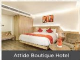
Attide Boutique Hotel

We ensure to meet the needs of our guests by providing excellent facilities. Being the best business hotel in Bengaluru, Attide hotels blends comfort and luxury to give an unparalleled experience which makes our guests visit us again in there next trip.