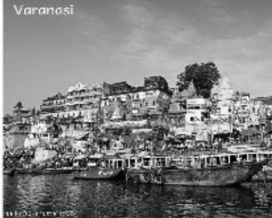
Varanasi- Allahabad 19th-22nd Mar 2020, 4N/5D (Cost to be Announced)