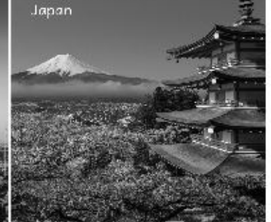
Japan- Cheery Blossom 14th-21st Mar 2020, 7N/8D @1,96,000(Approx.)