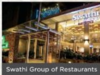
Swathi Group of Restaurants