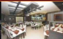
Add on Fine Dining