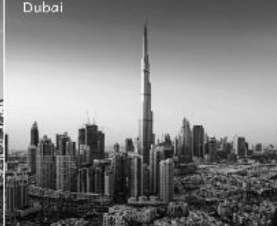
Dubai & Abu Dhabi 15th-19th Feb 2020, 4N/5D @61,000 INR