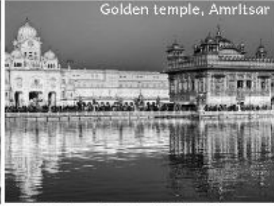
Vaishnodevi with Amritsar 19th- 23rd Nov 2019, 4N/5D @27,600 INR