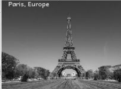
Enchanting Europe 6th 20th Apr 2020, 14N/15D @2,30,000(Approx.)