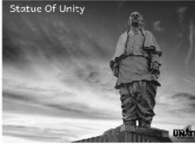
Statue of Unity 8th-10th Nov 2019, 3D/2N @13,000 INR