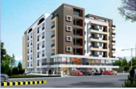
MATHA Jyothi Residency, Mukka Near Srinivas Institute of Technology and NITK Engineering College Mukka, Surathkal

mathadevelopers108@gmail.com www.mathadevelopers.com