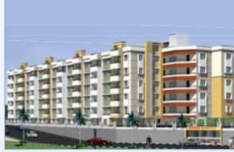
MATHA Residency, Maryhill Opp. to Mount Carmel Central School, Airport Road, Maryhill, Mangaluru